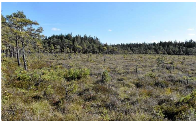
Snokamossen.