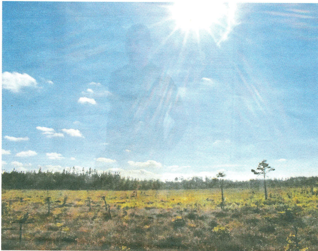
Snokamossen har varit aktuell för en etablering gällande solcellspark av Eco Energy World, ett svenskt-brittiskt energiföretag. Nu stoppar länsstyrelsen i Halland planerna och förbjuder EEW att bygga en solcellspark på mossen.